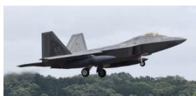
F-22A ラプターステルス戦闘機

明らかな基地機能の変容、強化であり、福生市民の安全・安心に対する脅威であることを述べ、外務省・防衛省は市長にどう説明し、市長はどう受け止めているか問いましたが、国からは「詳細を把握していない」との回答のみと答え、引き続き粘り強く基地問題の解決に向けて取り組むと答えました。