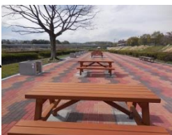
新バーベキュー場

私は、設置されている野外卓の中央にパラソルをさす穴をあけること、テントが強風で飛ばないように、固定用のボルトを埋め込むこと、風と熱射病対策のアイデアを市民から募集することを要望しました。