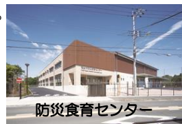
防災食育センター

福生市でも、昨年9月から、中学校を含む学校給食が防災食育センターを使って実施されています。毎議会ごとに中学校給食の実施を要望してきた私としては大変嬉しく思います。現段階での実施状況を質問しました。配達遅延もなく、喫食時間、授業に支障をきたすことなどもないとの回答で、一安心しました。しかし、子どもや保護者からの不満の声も、時々耳にします。市教委もいろいろな機会に関係者の声を聴取していると思いますが、適切な時期に、子どもと保護者全員を対象にアンケート調査し、一層の改善につなげることを要望しました。