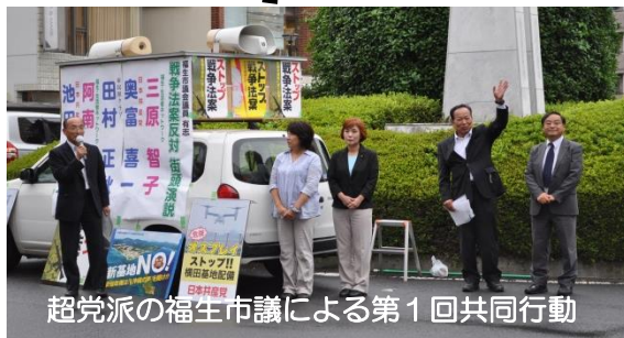
超党派の福生市議による第1回共同行動

戦争法案を廃案にしよう！の世論は、日に日に高まっています。連日、日本中の津々浦々で「憲法9条まもれ」の声が響いています。憲法9条を生かした平和外交を！の世論がふつと湧いてきています。私たち福生市議会議員有志は、横田基地を抱える福生市民の命と安全を守るためにも、この法案の廃案を求めてまいります。