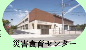
災害食育センター

防災食育センターが完成し、市民の長年の願いだった中学校給食が一昨年の9月から始まりました。