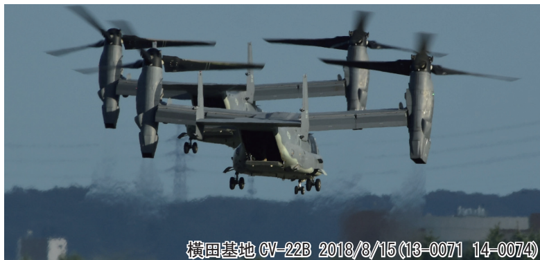
横田基地 CV-22B 2018/8/15(13-0071 14-0074)