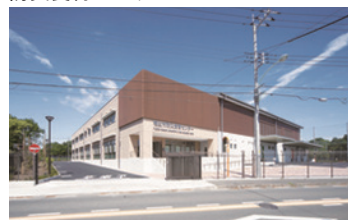
防災食育センター

今回は、人口減少対策・定住化対策としての有効性を、学校給食費の無償化を実施している自治体の人口動態から検証し、住宅施策の実施と合わせて、学校給食費無償化を実施で、新5G施策をより効果的な定住化施策にできると提案