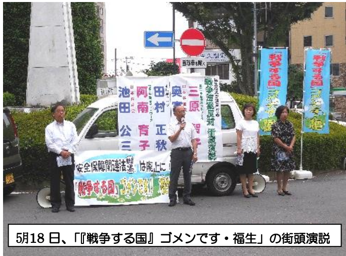
5月18日、『戦争する国』ゴメンです・福生の街頭演説

ここまで腐敗した安倍政権をなぜ自公は支え続けるのでしょうか。不思議ですね。安倍政権を総辞職させる最後の決め手はやはり世論です。世論に訴え、共に民主的な政治を実現するために、福生でも市民と野党の共闘が進んでいます。