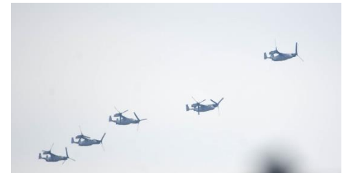
4月5日、福生市上空を飛行し、横田基地へ