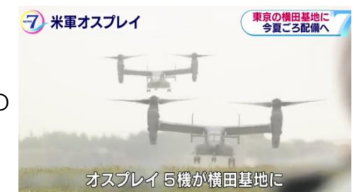
4月5日、NHK NEWS WEBより